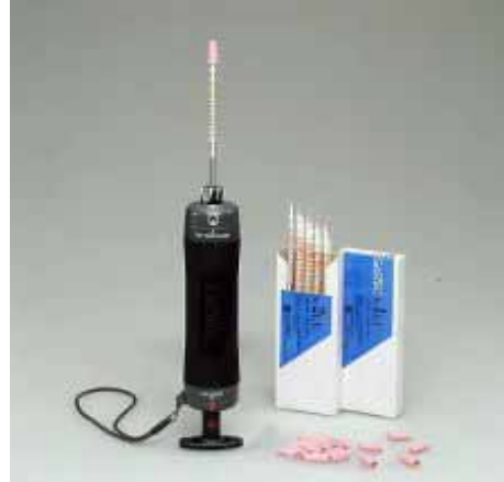
Gas Sampling Pump Kit GV-100S