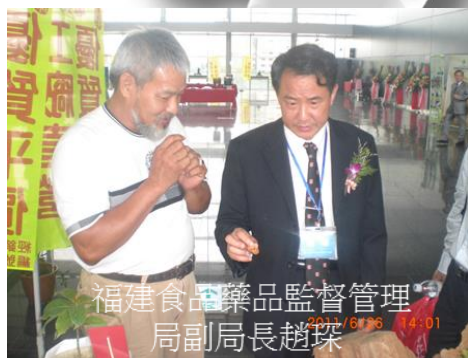
福建食品藥品監督管理局副局長趙琛