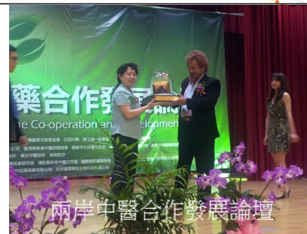
兩岸中醫合作發展論壇