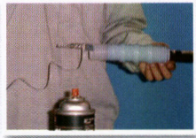
3. 反時針方向拉掉 內支撐塑膠帶