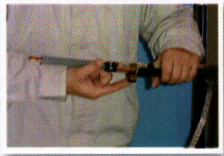
1. 電覽準備完成施作 接地鋼環組