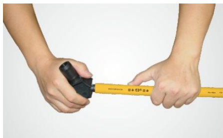
步驟二：先套上不鏽鋼套，再倒角整圓