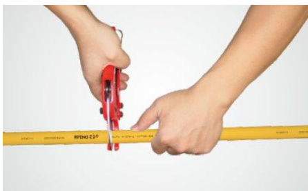
步驟一：剪管，注意保證端面平整