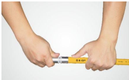
步驟三：將芯體部分完全插入到底