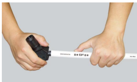
步驟二：先套上不鏽鋼套，再倒角整圓