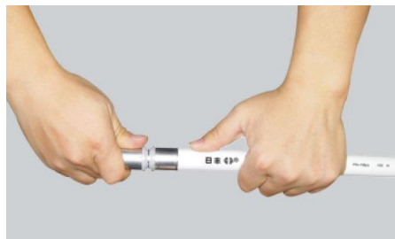
步驟三：將芯體部分完全插入到底