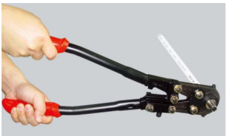
步驟四：用日豐專用工具，使鉗口完全閉合即可