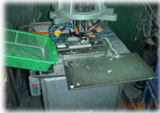
四軸自動攻牙機 15 台