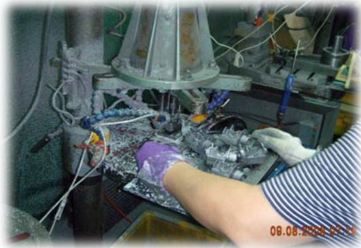
四軸自動鑽孔機 15 台