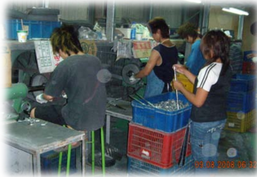
拋光設備 8 台 (一)