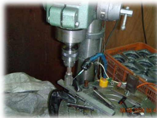
鏡頭大牙攻牙機 (手動)